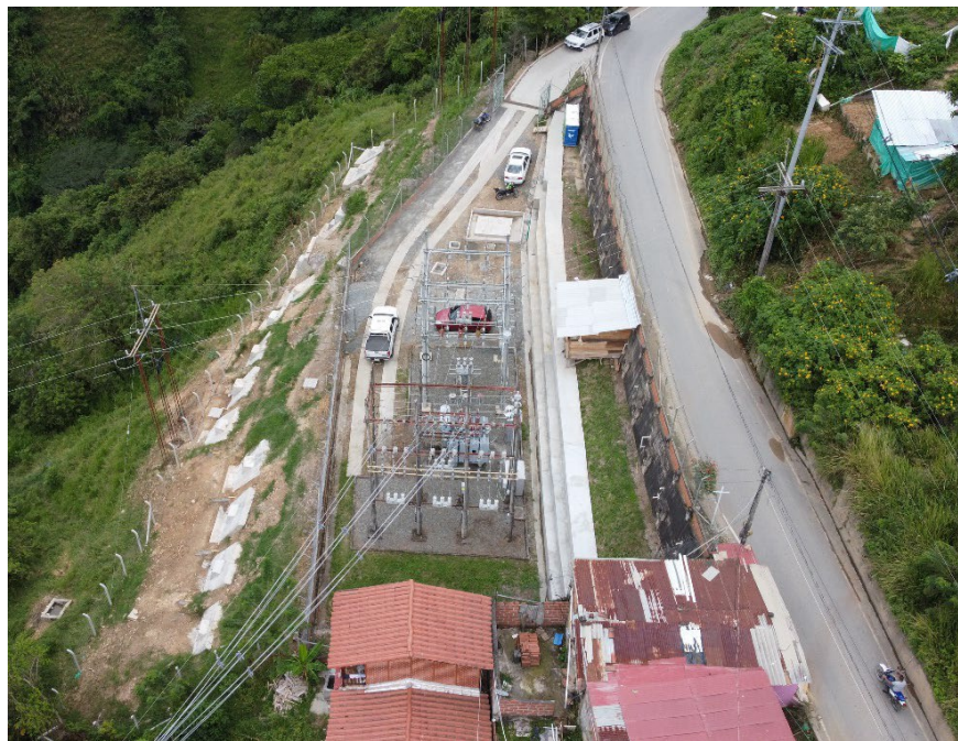
*Vista aérea Subestación El Dorado (Marmato – Caldas)

Con la modernización y reposición de los equipos se amplía la capacidad de la subestación para brindar mayor seguridad, confiabilidad al sistema eléctrico y mejorar así la prestación del servicio a la comunidad y garantizar nuevas conexiones.