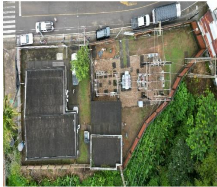
*Vista aérea Subestación Norcasia (Norcasia – Caldas)