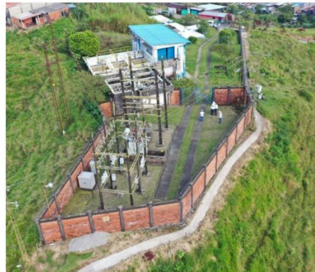
*Vista aérea Subestación Samaná (Samaná – Caldas)

CHEC ha trazado un ambicioso plan de inversión en infraestructura eléctrica para el período comprendido entre 2023 y 2027. Dentro de este plan, se encuentra el proyecto de Modernización y Repotenciación del Sistema de Distribución Local (SDL) en el Nororiente de Caldas. En este proyecto se contempla la modernización y actualización de la capacidad de las subestaciones Samaná y Norcasia CHEC S.A. E.S.P. BIC, lo anterior orientado en mejorar su eficiencia y confiabilidad, brindando mayor seguridad al sistema eléctrico regional, logrando así optimizar la prestación del servicio a la comunidad y garantizando nuevas conexiones.