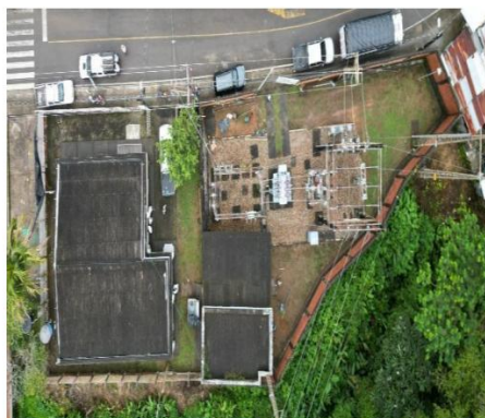
*Vista aérea Subestación Norcasia (Norcasia – Caldas)