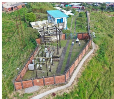
*Vista aérea Subestación Samaná (Samaná – Caldas)

CHEC ha trazado un ambicioso plan de inversión en infraestructura eléctrica para el período comprendido entre 2023 y 2027. Dentro de este plan, se encuentra el proyecto de Modernización y Repotenciación del Sistema de Distribución Local (SDL) en el Nororiente de Caldas. En este proyecto se contempla la modernización y actualización de la capacidad de las subestaciones Samaná y Norcasia CHEC S.A. E.S.P. BIC, lo anterior orientado en mejorar su eficiencia y confiabilidad, brindando mayor seguridad al sistema eléctrico regional, logrando así optimizar la prestación del servicio a la comunidad y garantizando nuevas conexiones.