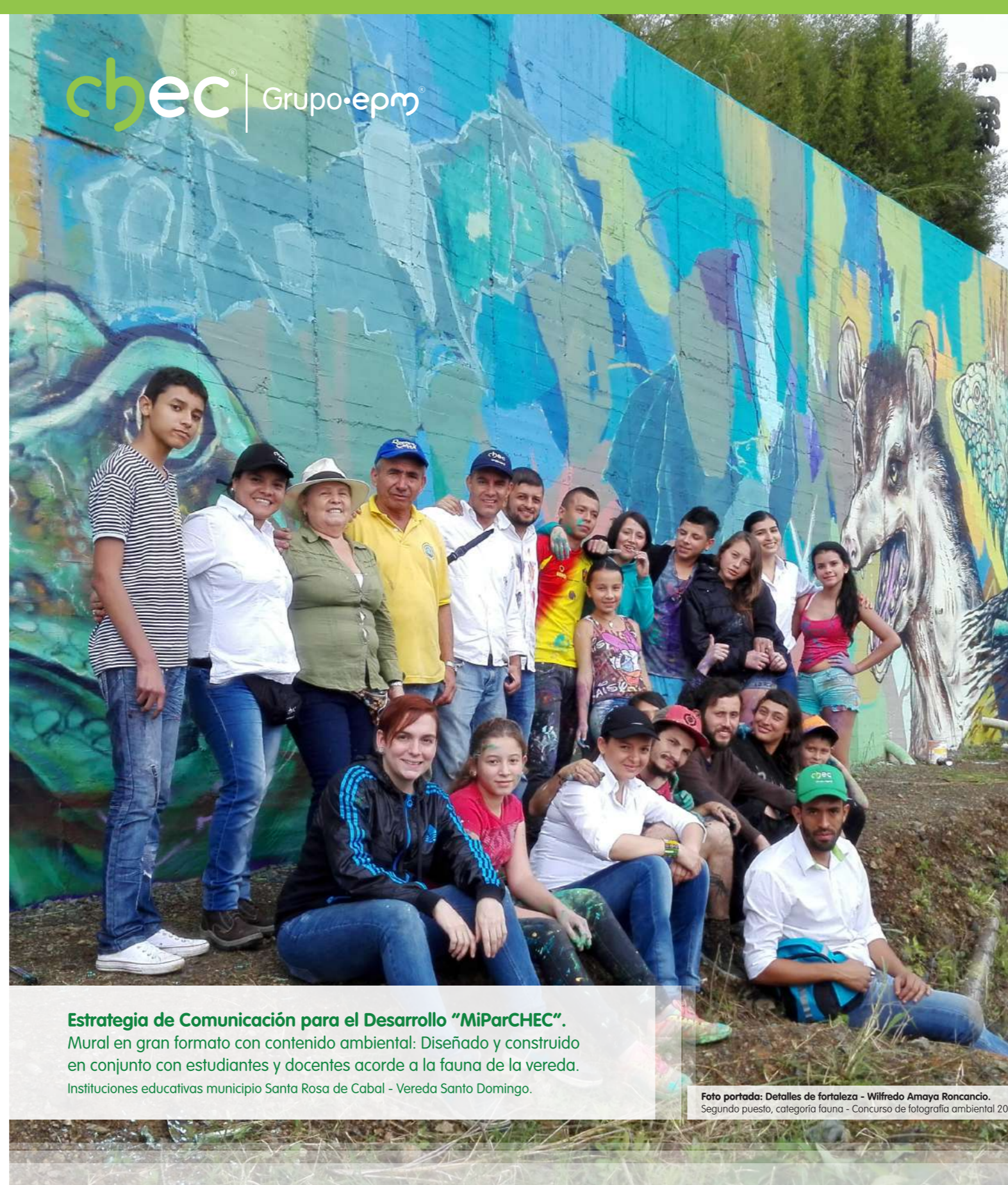
Estrategia de Comunicación para el Desarrollo "MiParCHEC". Mural en gran formato con contenido ambiental: Diseñado y construido en conjunto con estudiantes y docentes acorde a la fauna de la vereda. Instituciones educativas municipio Santa Rosa de Cabal - Vereda Santo Domingo.