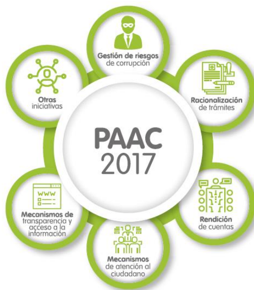
Ilustración 3 Informe de Sostenibilidad 2017