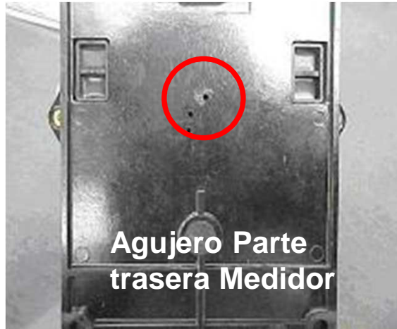
Agujero Parte trasera Medidor