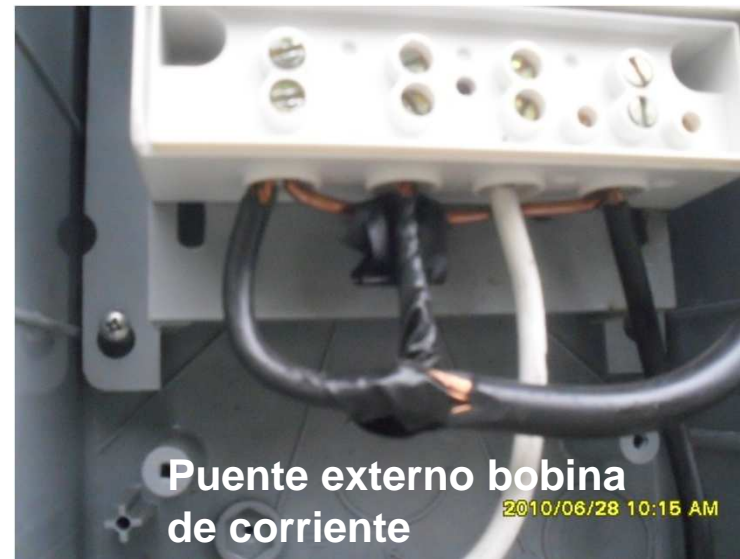
Puente externo bobina de corriente