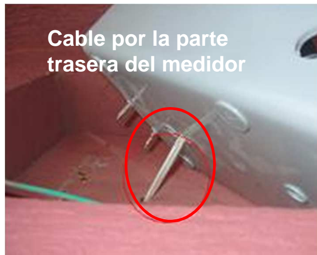
Cable por la parte trasera del medidor